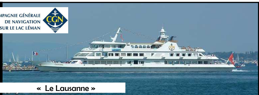
« Le Lausanne »

Mise en service en 1991 Capacité de 1500 pers. Restauration pour 500 pers. Longueur 80.8 m. Puissance 2x 870 kWh